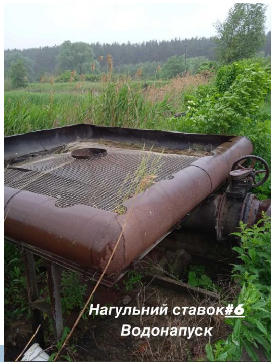
Нагульний ставок#6 Водонапуск