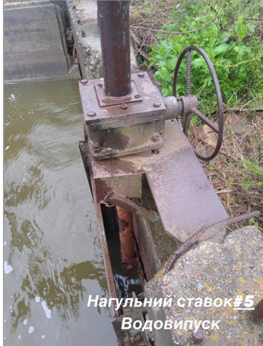
Нагульний ставок#5 Водовипуск