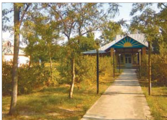
Запрошуємо на відпочинок