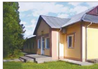
Відремонтований спальний корпус на 8 номерів