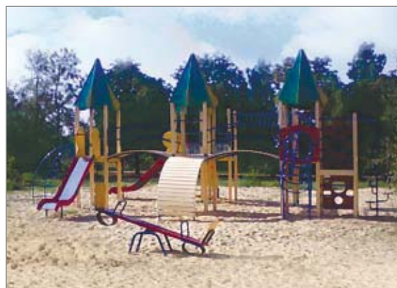
Сучасний дитячий майданчик