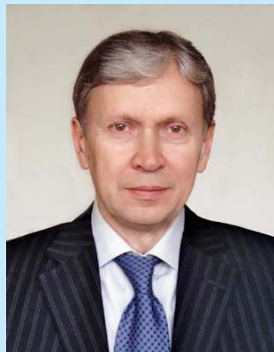
Голова Фонду державного майна України Олександр Володимирович РЯБЧЕНКО

Колектив Фонду державного майна України щиро вітає Олександра Володимировича РЯБЧЕНКА з призначенням на посаду Голови Фонду й бажає успіхів у кожній розпочатій справі, творчої наснаги та реалізації всіх планів і задумів.