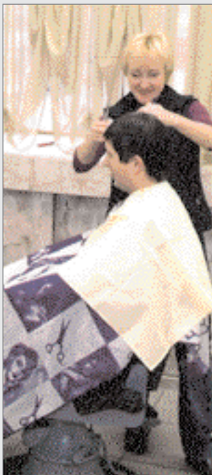
У перукарському салоні