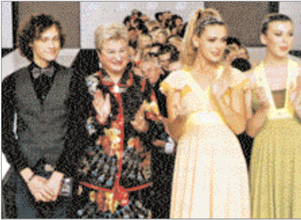
Разом з почесними гостями

казах «Сезонів мод» вони із задоволенням дефілюють в одязі від Едуарда Насирова і всі як один стверджують, що цей одяг легкий і зручний, елегантний і стильний.