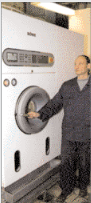
Технічне обладнання найвищого рівня

Київський будинок побуту «Столичний» пережив часи перебудови та вистояв у період руйнації та інфляції. Нині «Столичний» є базовим підприємством з надання побутових послуг населенню та одним із найбільших підприємств у своїй галузі в Україні. Тут за досить короткий проміжок часу можна зробити багато корисних справ: почистити, випрати та випрасувати одяг, полагодити або пошити новий (з тканини, трикотажу, шкіри, хутра тощо), сфотографуватися, замовити дублікат ключа, зробити зачіску, манікюр, відремонтувати біжутерію та ювелірні вироби. І найприємніше те, що залишилися навіть ті послуги, які не витримали перевірку часом і модою в інших місцях – приміром, дрібне штопання одягу, ремонт старих механічних годинників.