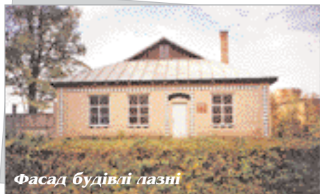
Фасад будівлі лазні

Будівля лазні розташована в центрі с. Руда Сквирського району. Відстань до м. Біла Церква – 21 км, залізничної станції «Біла Церква» – 24 км, автодороги Сквир – Біла Церква – 3 км.